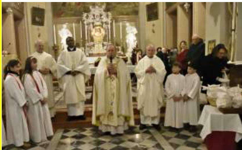
Al termine della Processione, la Benedizione del Pane di San Giuseppe