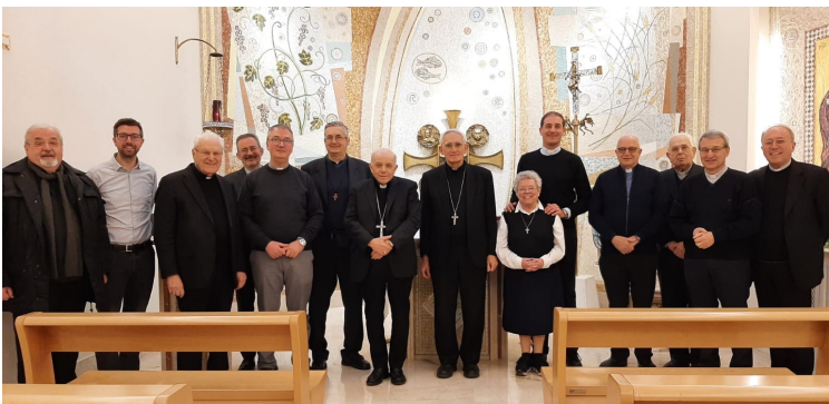
La delegazione che ha incontrato mons. Lamba a Roma a marzo

Sono consapevole della oggettiva "sproporzione" fra la missione affidatami e le mie qualità personali, ma come sempre