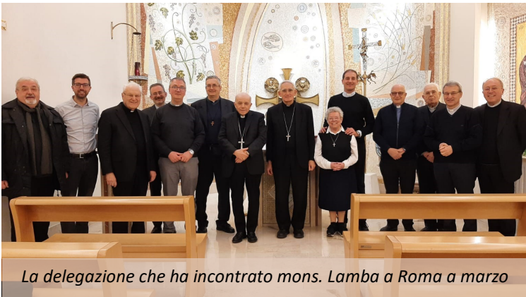
La delegazione che ha incontrato mons. Lamba a Roma a marzo

Sono consapevole della oggettiva "sproporzione" fra la missione affidatami e le mie qualità personali, ma come sempre