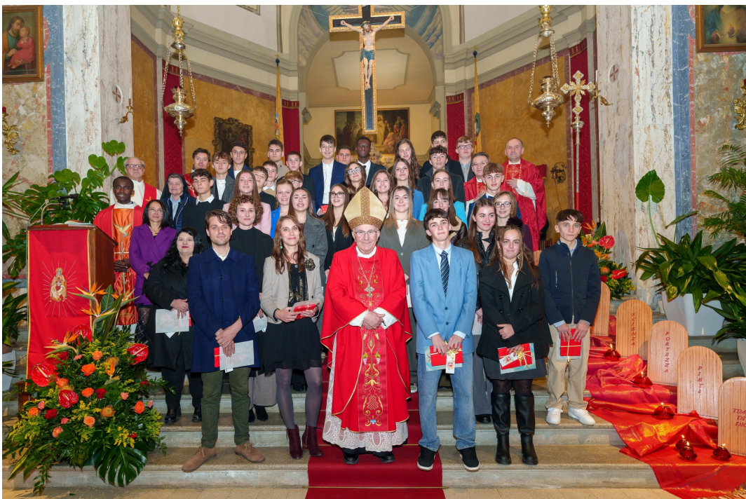
Hanno ricevuto la Cresima domenica 17 novembre, nel Duomo di Variano: