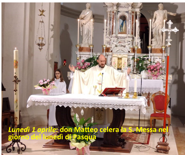
Lunedì 1 aprile: don Matteo celebra la S. Messa nel giorno del lunedì di Pasqua