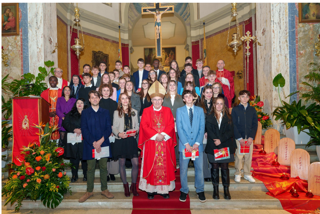
Hanno ricevuto la Cresima domenica 17 novembre, nel Duomo di Variano: